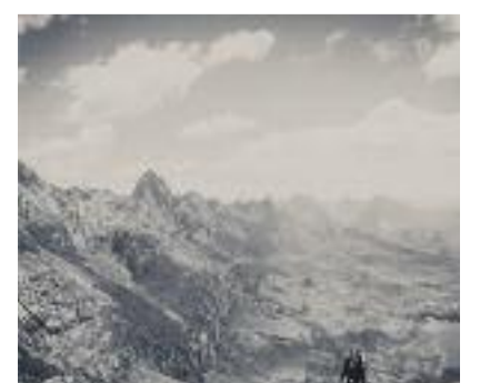
Terre di uomini Filippo Salvioni