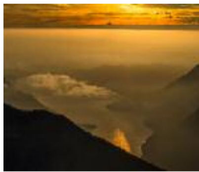
Tramonto sul lago di Como Mauro Bertolini