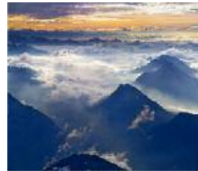
Ribollire di nubi sull'alta Valdivedro Sergio de Leo