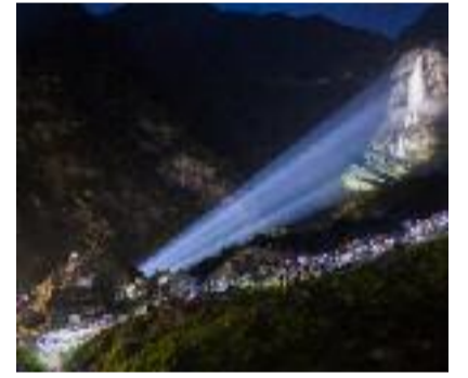
Proiezione naturale Luca Bentoglio