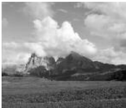
Nubi sul Sassolungo Gabriele Sala