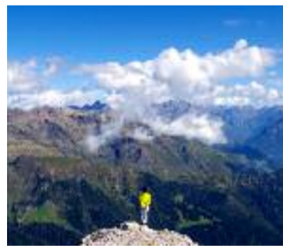
Pizzo Arera Angelo Corna