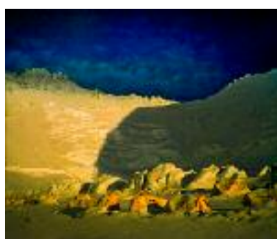
Un mondo di ghiaccio Sergio de Leo