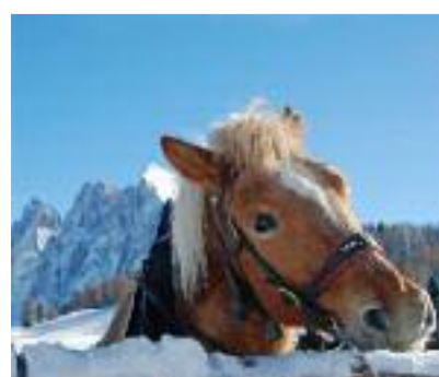
Sogno cavalcar le creste Ettore Ruggeri