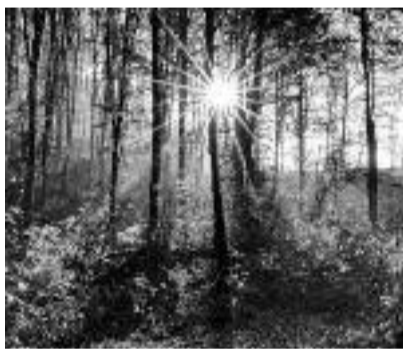
Bosco Valle Imagna Fabio Ghisalberti