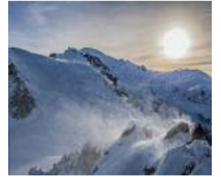
Re delle Alpi Luca Bentoglio