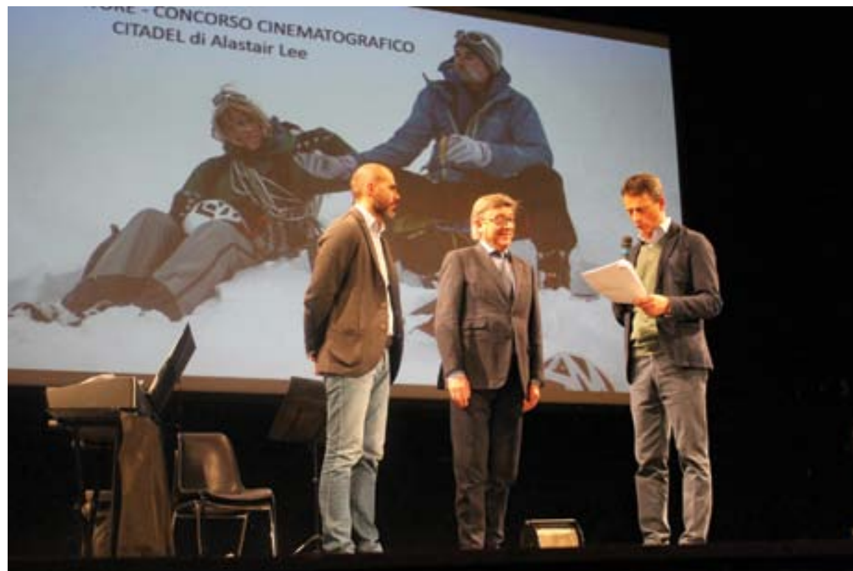
Film vincitore 2016: CITADEL di Alastair Lee

Nella serata finale verrà consegnato un riconoscimento ad ogni regista/produttore delle opere cinematografiche vincitrici.