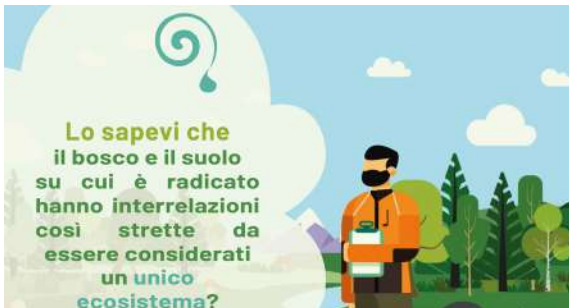
Suolo e foreste. Un unico ecosistema | Erica Bo | Italia | 15'

La regione denominata Water Forest è una delle aree boschive con la maggiore biodiversità del Messico. Oltre a fornire la maggior parte dell'acqua consumata in 3 delle principali città del centro del paese, fornisce molteplici servizi ecosistemici all'area più popolata del Messico.