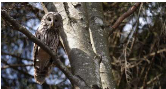
Allocco degli Urali-Tra Italia e Slovenia | Marco Favalli | Italia | 13'

Campagna informativa di Regione Piemonte sui temi del suolo, i post disturbi (e cioè cosa avviene in un bosco dopo eventi estremi), la prevenzione e la resilienza, il carbonio e la regimazione delle acque. Il bosco è un elemento essenziale dell'ambiente in cui viviamo, è una risorsa per tutti e ha un prezioso alleato che deve gestirlo in modo appropriato e sostenibile, l'uomo.