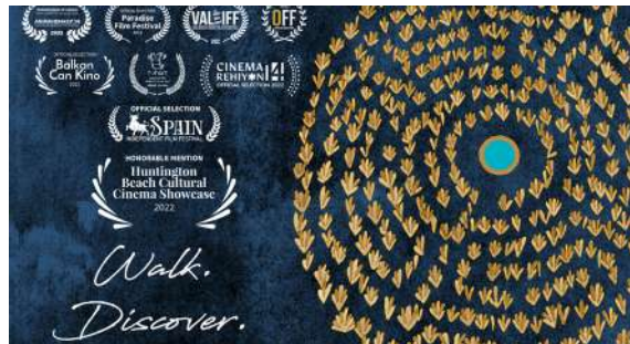
Labyrinth | Nima Ghazanfari | Iran | 14'

Il Popolo del cipresso è un documentario prodotto da Magic Mind Corporation e girato nella Patagonia cilena. La storia è incentrata sui personaggi che ruotano attorno al cipresso delle Guaitecas, un albero che per anni è stato tagliato e commerciato dai "madereros" e che figura tra le specie minacciate.