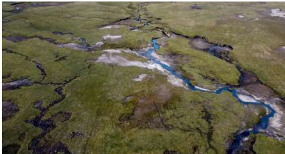
Bosque de agua | Adrián Arce | Messico | 27'

La regione denominata Water Forest è una delle aree boschive con la maggiore biodiversità del Messico. Oltre a fornire la maggior parte dell'acqua consumata in 3 delle principali città del centro del paese, fornisce molteplici servizi ecosistemici all'area più popolata del Messico.