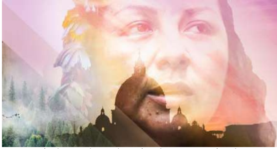
Anamei | Alessandro Galassi | Italia-Messico | 63'

Quando ormai la terra sarà sul punto di distruggersi, quando l'umanità si troverà sull'orlo dell'abisso, quell'albero verrà. Un albero ci salverà. E sarà l'albero di Anamei.