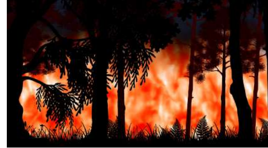
Burning land | Carla Pampaluna | Italia | 26'

Quando ormai la terra sarà sul punto di distruggersi, quando l'umanità si troverà sull'orlo dell'abisso, quell'albero verrà. Un albero ci salverà. E sarà l'albero di Anamei.