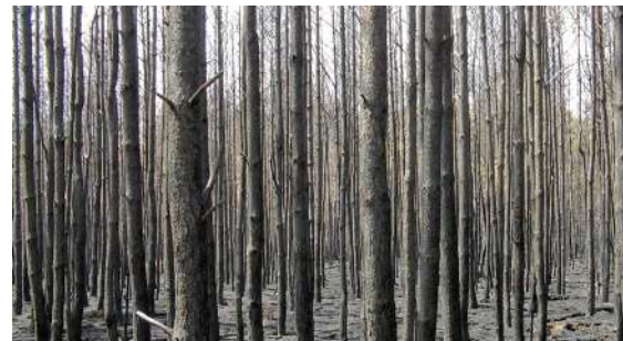
Des Équilibres | J. Catley-J.Hajem-M. Schwartz | Francia | 9'