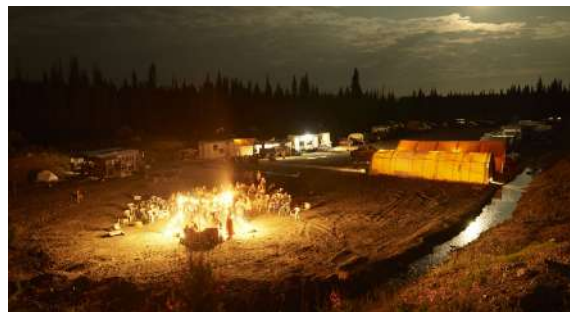
Forest for the trees | Rita Leistner | Canada | 91'

Il pellegrino si ritrova senza volto tra la folla. La città è rumorosa, il mondo è caotico. Il suo vagabondare lo porta in un labirinto. I labirinti sono un antico esercizio spirituale utilizzato per meditazione, preghiera e contemplazione. Ma questo labirinto conduce verso il centro. Raggiungere il centro del labirinto è un viaggio intorno al labirinto stesso.