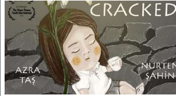
Cracked | Katalin Egely | Turchia | 5'

Una bambina vive in un villaggio con sua madre dove le fonti d'acqua stanno diminuendo di giorno in giorno. La siccità influenza la sua immaginazione. Non solo le persone, ma la natura lotta con l'inesorabile aridità. Questa bambina, però, non perde mai la speranza. Cerca di fare del suo meglio, sacrificandosi da sola per la sua amata natura.