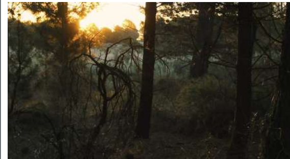
A beginning | Lucia Benamo | Argentina-India | 10'

Una bambina vive in un villaggio con sua madre dove le fonti d'acqua stanno diminuendo di giorno in giorno. La siccità influenza la sua immaginazione. Non solo le persone, ma la natura lotta con l'inesorabile aridità. Questa bambina, però, non perde mai la speranza. Cerca di fare del suo meglio, sacrificandosi da sola per la sua amata natura.