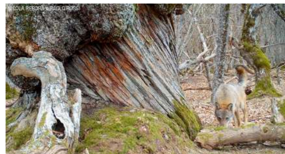
Survivor of the Homo Sapiens | P. Rossi-N. Rebora | Italia | 19'

Due ricercatori discutono i concetti di ecosistemi e biodiversità e gli squilibri causati dalle attività umane. Parlano di come ristabilire certi equilibri e con loro vediamo tutto ciò che possiamo imparare dalla diversità del mondo vivente.