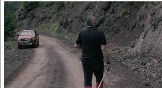
Discovered and Going Extinct! | Robin Bisio | Turchia | 11'

Questo cortometraggio cerca di unire visioni di paesaggi lontani. Da un lato, la vita pastorale quotidiana che fa parte del folklore di Shimla (ai piedi dell'Himalaya occidentale, India) e dall'altro, la cruda realtà che attraversa la geografia argentina con il costante e indiscriminato rogo di foreste.