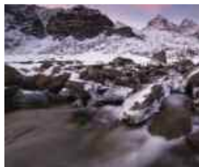
Il freddo risveglio del Po Erica Castagno