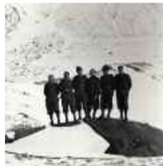
MONCENISIO. MEMORIE E CRONACHE DI CONFINE

Italia, 2014, 48' Regia di Fabrizio Arietti e Renzo Pierantoni Lingua: italiano