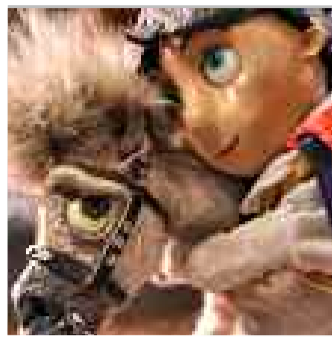
YO TE QUIERO

Argentina, 2015, 8' Regia di Nicolas Conte Lingua: senza dialoghi