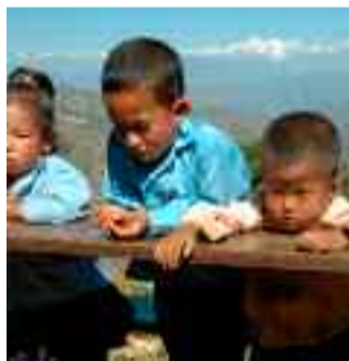
FRIULI MANDI NEPAL NAMASTE

3 young men without experience in mountaineering decide to climb the Lanín volcano. The movie tells about the precautions to take in order to ascend the mountain, describe the geography of the Tromen National Park, and share old stories about legends and prayers to the nature that add value to the meaning of the ascend.