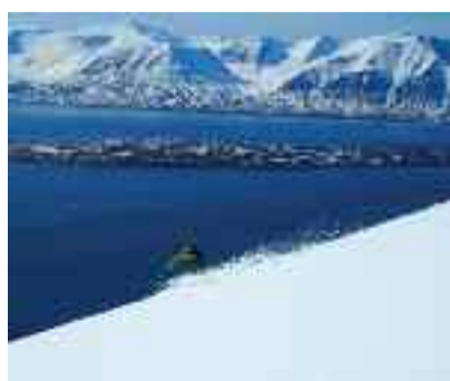
"Conducimi" all'oceano Luca Blanchet