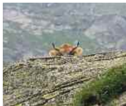
Cache cache Carlo Ravetto