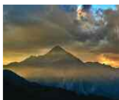
The last light over the Alps Federico Milesi