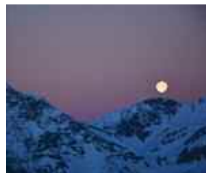
Lo Chaberton e la luna Vittorio Gribaudi