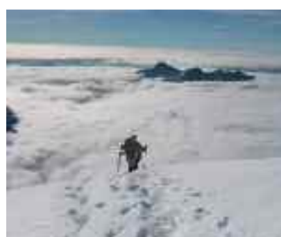
Bianco naufragio Luca Bonati