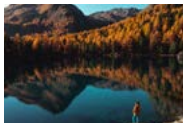
Giacomo Guidetti Perfezione naturale