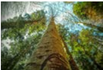
Fabio La Rosa Orizzonti verticali