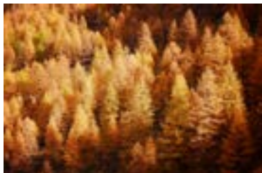
Erasmus Forcina Larici illuminati dautunno