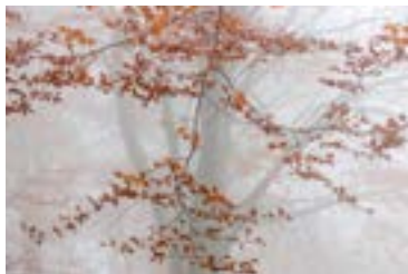
Sonia Fantini Autunno nella faggeta