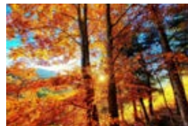
Thomas Danieli Impressioni d'autunno