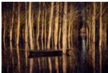
Andrea Amato Zone umide