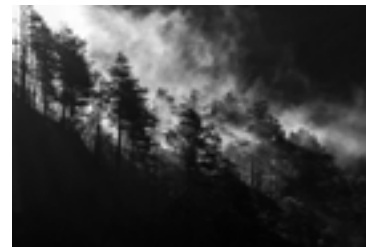
Paola Toniutti Il primo respiro